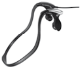
Digta Headphone 520