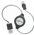
USB RollUp 991